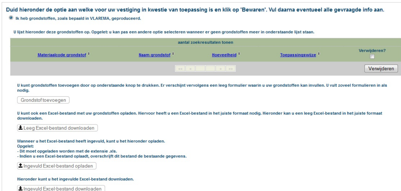
Fig.4 – startscherm deel Grondstoffen – 1° optie geselecteerd