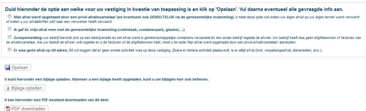
Fig.3 – startscherm deel Afval