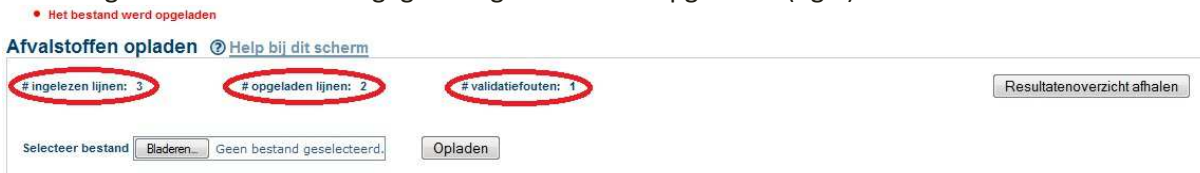
Fig.9 – controle bij opladen van Excel-bestand

3. vervolgens kunt u zien of de gegevens goed werden opgeladen (fig.9).