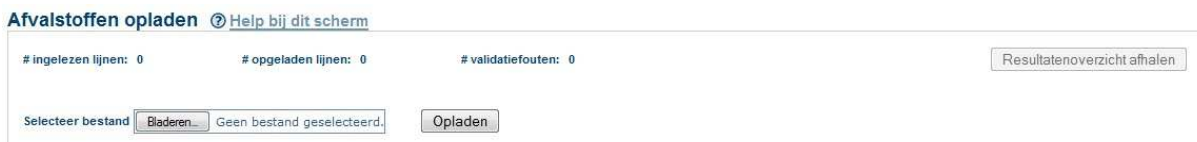
Fig.8 – ingevuld Excel-bestand opladen