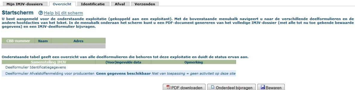
Fig.1 – startscherm IMJV-loket