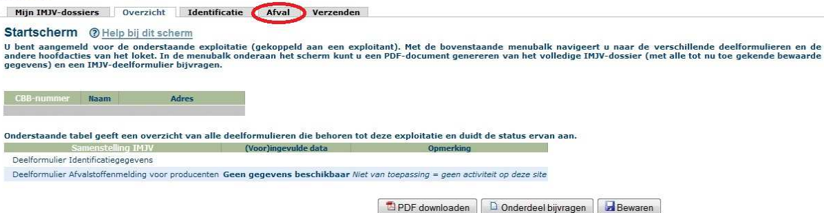
Fig.2 – startscherm IMJV-loket

Om deel Afval in te geven, klikt u bovenaan op het tabblad 'Afval' (fig.2).