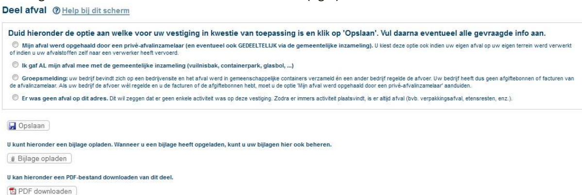
Fig.3 – startscherm deel Afval

Vervolgens komt u in het startscherm van deel Afval (fig.3).